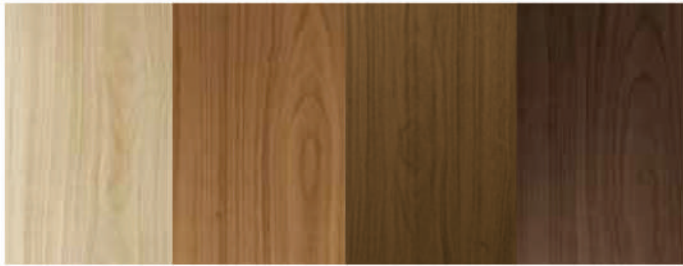
MPWI - MPWOS - MPWOR