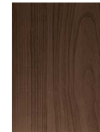
BLACK WALNUT nogal negro