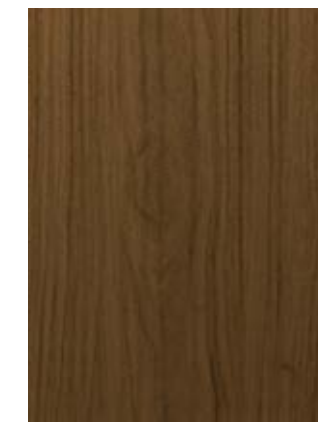
DARK OAK roble oscuro