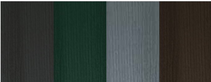
MPSTONE - MPSTONE AS - MPSTONE 20

WOODEN PATTERN Système de peinture unique qui simule l'aspect de surface du bois, mais peint directement sur l'acier, formulé pour des applications intérieures et extérieures, avec une excellente résistance à la corrosion et aux rayons UV, garantissant une durabilité maximale.