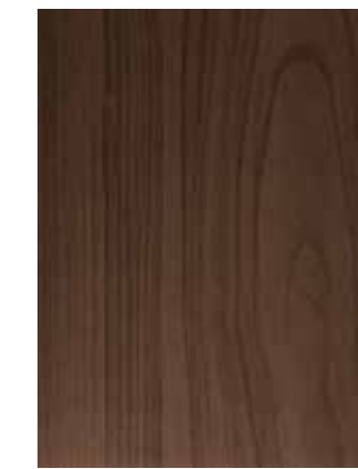
BLACK WALNUT nuc negru