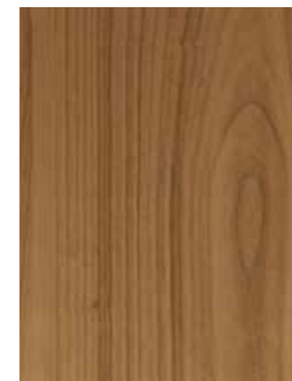
GOLDEN OAK stejar auriu