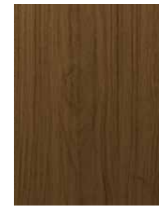
DARK OAK stejar închis