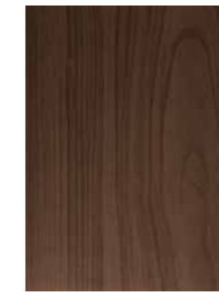
BLACK WALNUT czarny orzech