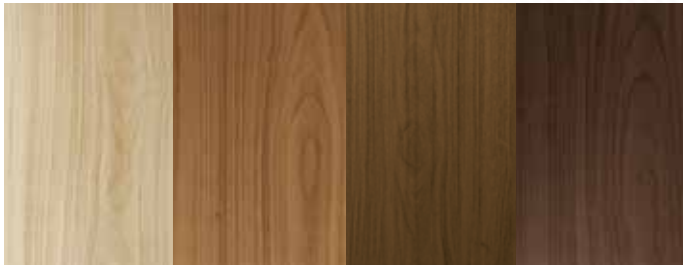
MPWI - MPWOS - MPWOR