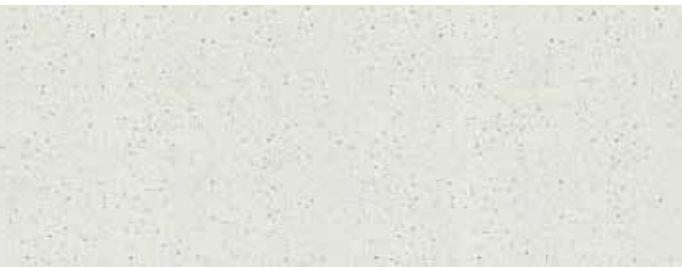
COATEEL® MPWALL RC4

COPPO-MUSTER Marcegaglia Qualität, vorlackierter Stahl mit Polyesterharzen, die ein fertiges Produkt für eine Vielzahl von Anwendungen garantieren. Besonders geeignet für Anwendungen auf Wohndächern in gewöhnlichen Umgebungen mit einem durchschnittlichen Verschmutzungsgrad.