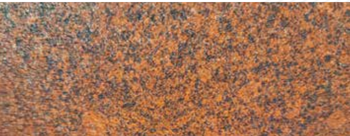
COATEEL® MPCORTEN RC4

MURO PATTERN Vorlackierter Stahl mit Kunstbetonwandeffekt; mit einer starken visuellen Wirkung wurde das Lackiersystem entwickelt, um die Einschränkungen von mit laminiertem Kunststoff überzogenem Stahl zu kompensieren. Die aliphatische transparente Oberfläche garantiert eine signifikante Beständigkeit für den externen Gebrauch mit einer ungefähren Lebensdauer von mindestens 15 Jahren.