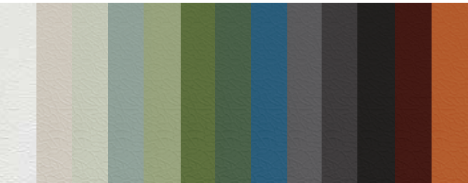
COATEEL® ARMORMAX MPS200 RC5

SHIMOCO® Enthält kein sechswertiges Chrom und Schwermetalle. Besonders geeignet für Anwendungen auf Dächern – kann auch für Fassaden und Beschichtungen verwendet werden.